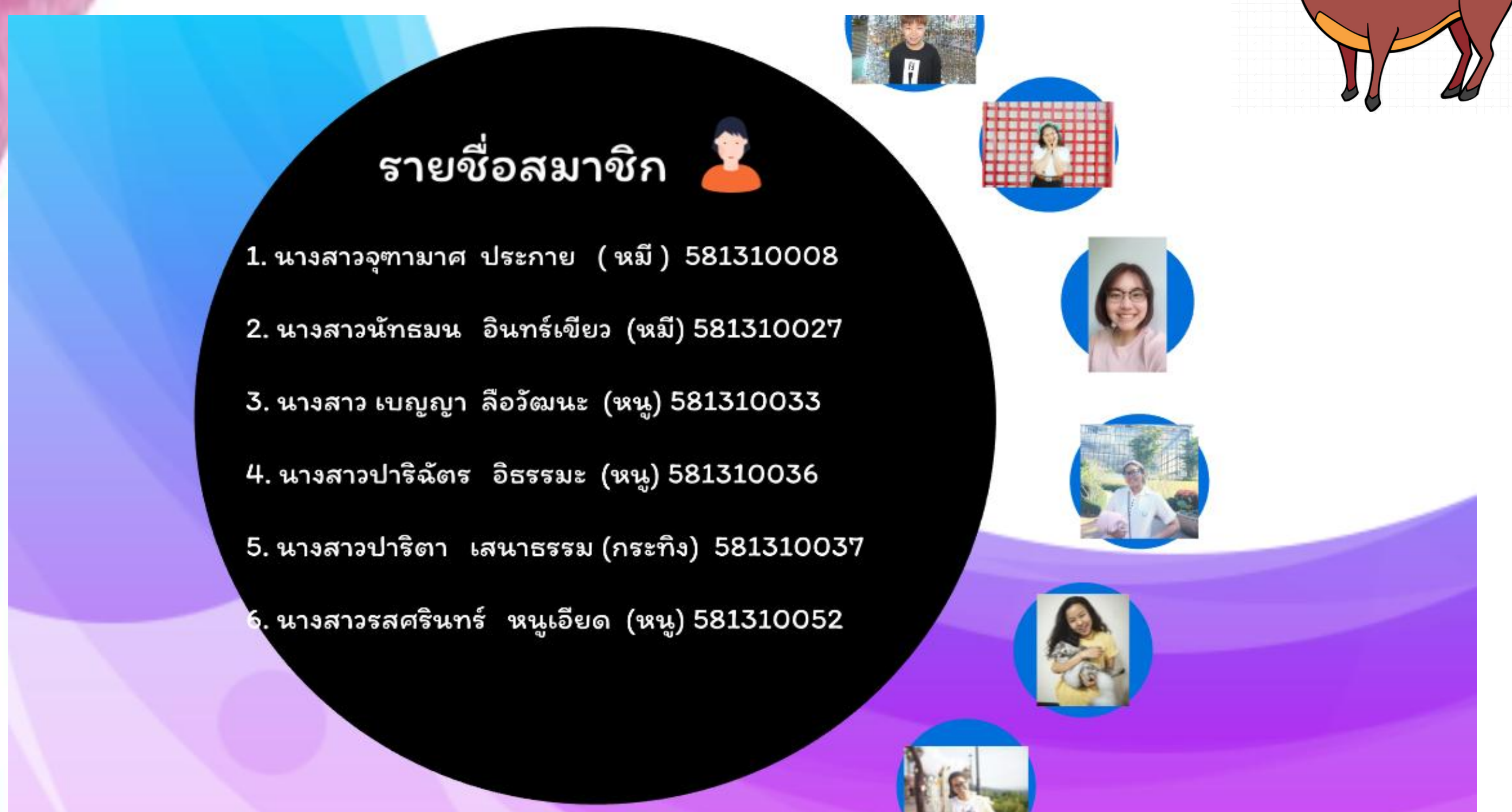
รูปที่ 3 ผลงานนำเสนอในหน้าแรก แสดงสมาชิกของกลุ่มไม่เอาะเกรงใจ

สรุป: จากการประเมินบุคลิกภาพของผู้เรียนในชั้นเรียน จำนวน 30 คน ประกอบด้วย หมู 3 คน อินทรีย์ 3 คน กระตึง 3 คน นอกนั้นจัดอยู่ในประเภทหนู และทั้งหมดแบ่งกลุ่มได้ 5 กลุ่ม จากการมอบหมายงาน มีผู้ส่งผลงานนำเสนอหลังการนำเสนอ 3 กลุ่ม ถูกต้องตามคำสั่ง 2 กลุ่ม ไม่สมบูรณ์ 1 กลุ่ม อีก 2 กลุ่มนำเสนออย่างเดียว ไม่ส่งผลงานสุดท้าย โดยไม่มีการบังคับการส่ง ทั้ง 2 กลุ่มที่ส่งงานสมบูรณ์เป็นกลุ่มที่มีสมาชิกบุคลิกภาพแบบหมู ในขณะที่กลุ่มอื่นไม่มี ใน 2 กลุ่มนี้ มีกลุ่มหนึ่งที่มีหมู 2 คน ตัดสินใจอยู่ในกลุ่มเดียวกัน ตามรูปที่ 2 และ 3 จากกลุ่มตามรูปที่ 2 ขาดบุคลิกกระตึง โดยมีข้อสังเกตว่ากลุ่มนี้ ในแต่ละครั้งสมาชิกไม่คอยครบ แต่ก็ยังสามารถตอบถามและแสดงผลงานได้ และมีการให้ความสำคัญกับความสวยงามในผลงานนำเสนอ จากกลุ่มตามรูปที่ 3 ขาดบุคลิกอินทรีย์แต่มีกระตึง โดยมีข้อสังเกตว่าแต่ละครั้งกระตึงมักเป็นผู้ออกมาเป็นตัวแทนออกมาหน้าชั้น งานกลุ่มมีความเป็นระเบียบ เป็นผู้นำในการทำคะแนนการตอบคำถาม และกลุ่มอื่นที่มีส่วนของบุคลิกภาพหนูโดยส่วนใหญ่ มีความสามารถในการทำงานตามที่ได้รับมอบหมายตามปกติ แต่สังเกตได้ว่ามักนั่งเฉยต่อโอกาสในการแข่งขัน และไม่แสดงความชอบหรือไม่ชอบในการร่วมกิจกรรมนั้นๆ ทั้งนี้ก็มีการให้ความร่วมมือดี