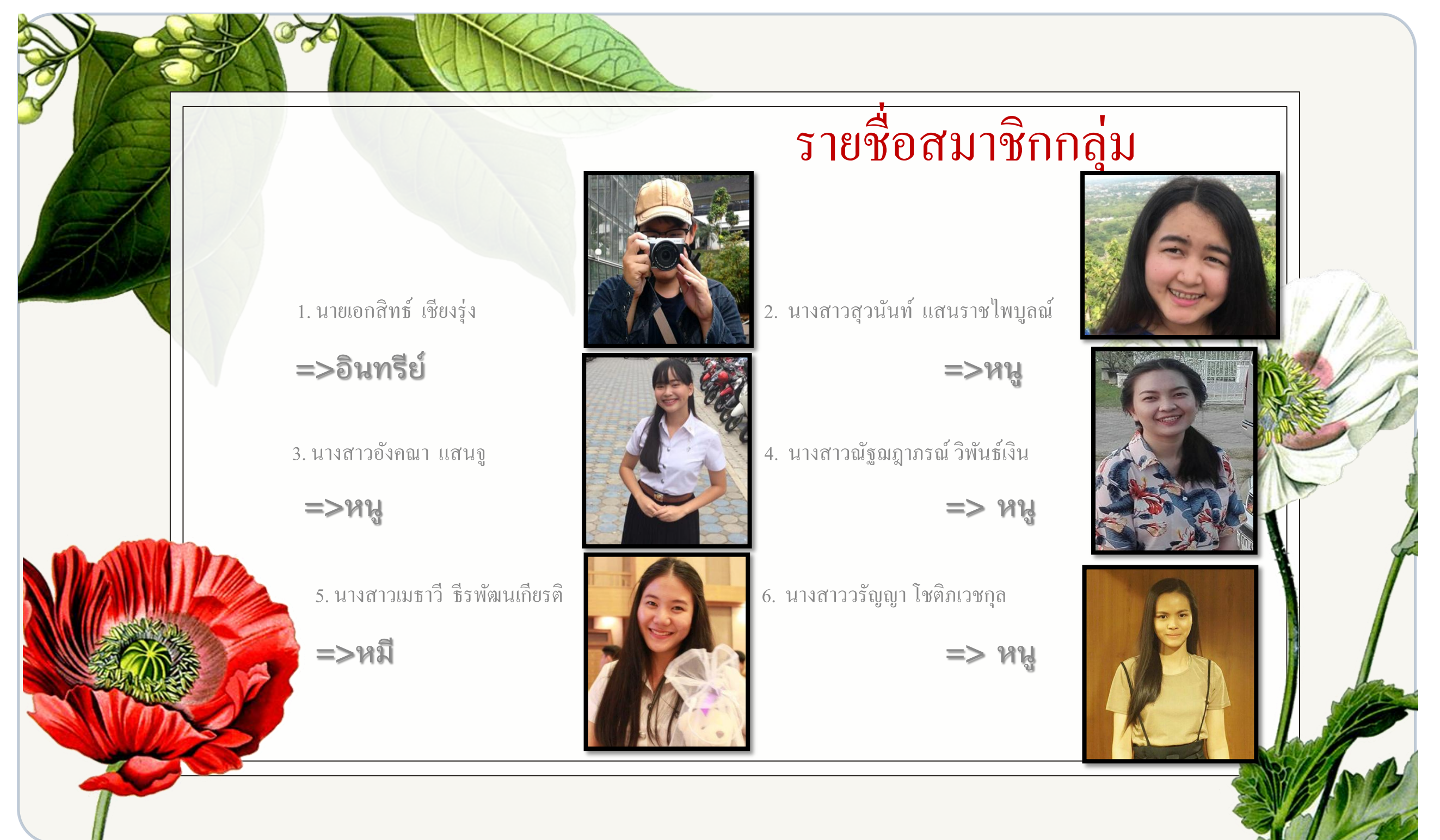
รูปที่ 2 ผลงานนำเสนอในหน้าแรก แสดงสมาชิกของกลุ่มแคโรทีนอย น้อย นอย

สมมุติฐาน: หากผู้เรียนที่มีความหลากหลายในเรื่องบุคลิกภาพ มาเรียนรู้และทำงานร่วมกัน ก็จะสามารถทำให้เกิดการเรียนรู้และวางแผนที่ดีเพื่อการผลิตผลงานที่มีประสิทธิภาพได้